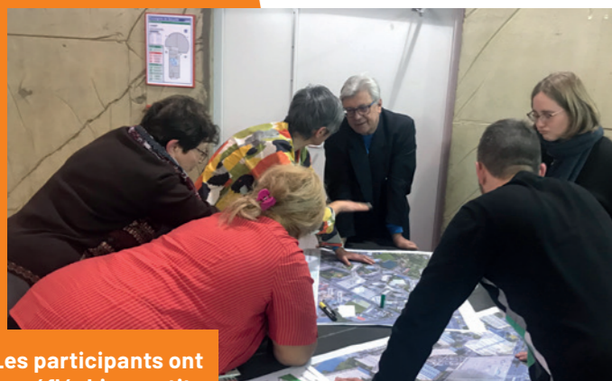
Les participants ont réfléchi en petits groupes, avant une mise en commun de leur travail.

Au début de l'année 2020, deux ateliers de concertation ont déjà eu lieu sur la future place de Londres. L'objectif est de faire évoluer votre quartier avec vous, pour qu'il corresponde à vos envies et à vos besoins. Vous avez été nombreux à y participer et nous vous en remercions. Tout au long du projet, des rendez-vous seront proposés pour vous informer et connaître vos attentes.