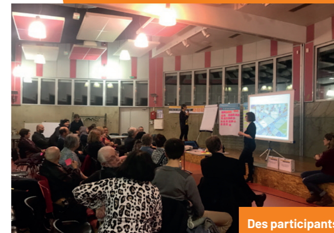
Des participants enthousiastes, de l'ambiance et des échanges nombreux !

Le second serait dédié aux services et aux commerces. La création de chemins piétonniers et de pistes cyclables permettrait un meilleur partage de l'espace pour des déplacements sécurisés.